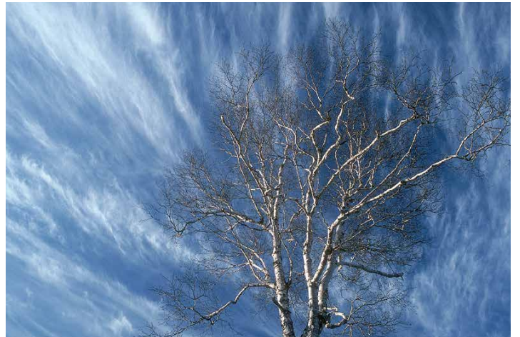
(上) 苔の洞門仰景 (千歳市) (左下) 黄金に輝く岩礁と波 (室蘭市) (右下) 春風に流れる雲 (札幌市)